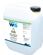
ref. 062511 Speciaal laskoelmiddel - 5 l