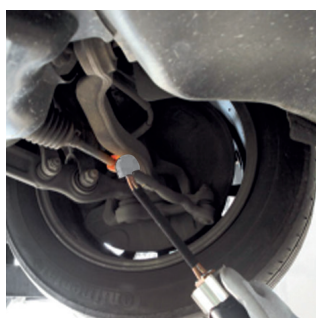
Het deblokken van trekstangen