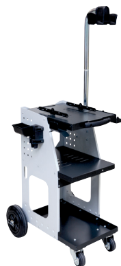
ref. 051331 + 052284 UNIVERSAL 800 + steunarm