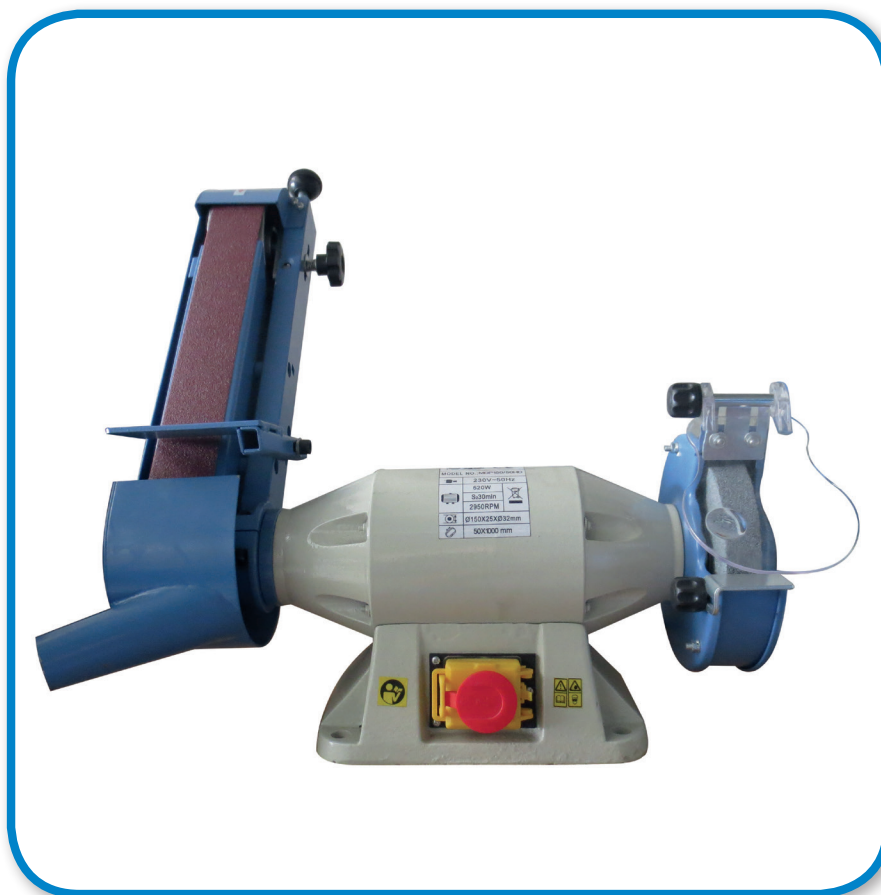
PONCEUSE A BANDE ABRASIVE COMBI BSM 150 CE N° de cde. 19009