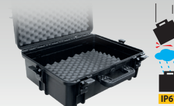
Valise de transport 060432